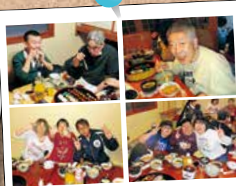
2017.3.7 地域外食会 (追分館)