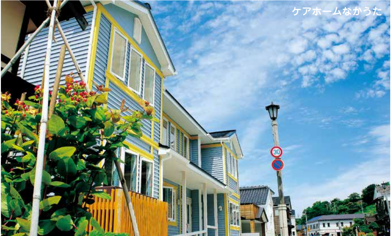
ケアホームなかうた