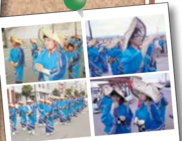
2017.7.1 かもめ島まつり千人パレード