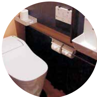
ウォシュレット対応のトイレ