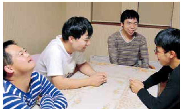
ダイニングではゲームの話で盛り上がります。