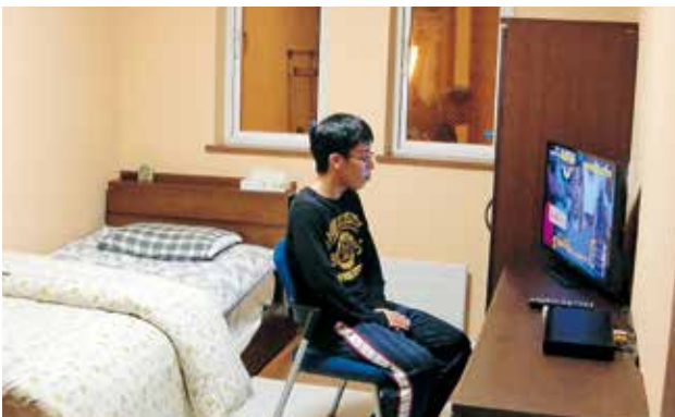
窓の向こうには江差町役場が見えますよ。