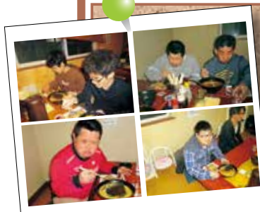
2017.3.7 地域外食会 (麺屋亭)